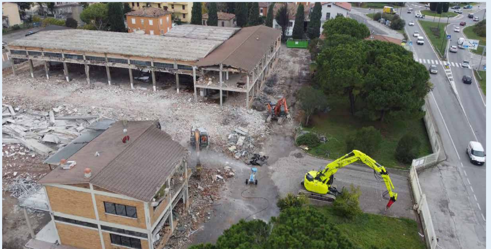
Una veduta dei lavori di demolizione dell'ex stabilimento Paglierani

porterà lavoro e produzione legati al commercio e alla salute della persona, con infrastrutture destinate alla viabilità e alla sosta. "L'accordo con la proprietà – puntualizza – prevede che questa si faccia carico anche di due opere in dotazione straordinaria: il prolungamento della pista ciclabile sulla via Emilia dalla strada di Gronda fino a via Ca' Fabbri e il primo tratto del percorso lungo la ex ferrovia Santarcangelo-Urbino, che dall'intersezione con la Gronda proseguirà fino al quartiere Flora. Opere per oltre 700mila euro – conclude Sacchetti – che vanno a completare una rete strategica per la mobilità sostenibile di Santarcangelo".