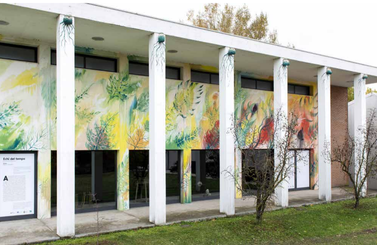
L'opera "Oltre la primavera silenziosa", realizzata sulle pareti del magazzino del Met

essere letto come un testo: la narrazione di un lento ritorno degli uccelli nel paesaggio agricolo e naturale che va via via ripopolandosi, a cui fa seguito anche la ricomparsa di tutti gli animali".