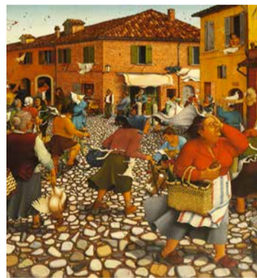
Pino Boschetti, Il vento , 1985

Boschetti ha varcato la soglia terrena il 29 ottobre all'età di 78 anni, ma la sua amata città non l'ha lasciata e lei non lo ha perso. Resta vivo, sempre, per il suo immenso dono di vita e arte, per la sua grande umanità e garbo, per la sua pittura che tutti i cittadini conoscono, amata, apprezzata e premiata in Italia e all'estero. Entrato a pieno titolo a far parte della grande famiglia dei pittori naif era stato insignito, tra gli altri riconoscimenti, della Medaglia d'oro del Presidente della Repubblica al prestigioso Premio Nazionale delle Arti Naives di Luzzara. Come l'ha dipinta lui Santarcangelo nessuno lo aveva mai fatto perché ciò che il nostro sguardo ammirato coglie nei suoi quadri, è la città vissuta, ricordata, sognata, immaginata dalla sua straordinaria sensibilità, dal suo profondo ed empatico sentire. Ne ha colto e restituito la sua personale visione, di ogni angolo, monumento,