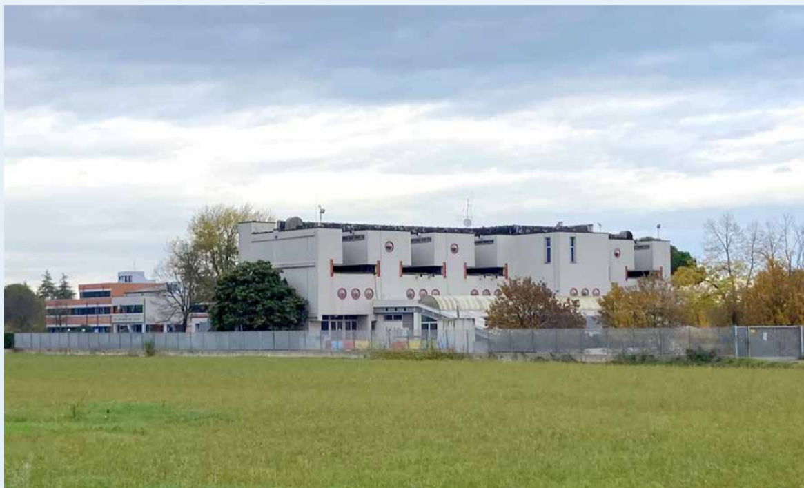
Il Piano triennale dei lavori pubblici prevede l'ampliamento della sede centrale della scuola media "Teresa Franchini"